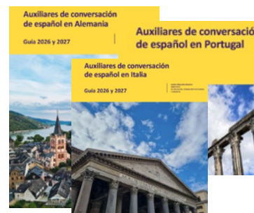
Auxiliares de conversación de español Guías 2026 y 2027