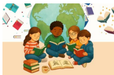
Buenas prácticas lectoras tras el Día del Libro