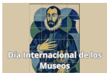
Celebramos el Día Internacional de los Museos