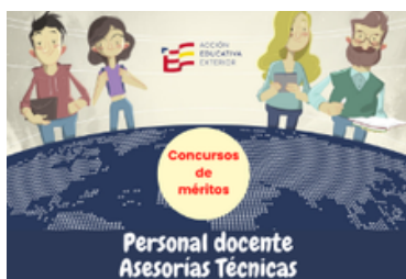
Resolución de los concursos: docentes y asesorías técnicas

Finalmente, otras iniciativas destacadas han sido la colaboración de la Asesoría de Educación en Suecia con la Fundación Cultural de la Princesa Estelle para promover el español a través del arte y el III Congreso Nacional de Enseñanza de español en Australia.