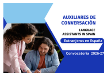
¡Nueva convocatoria! Auxiliares de conversación extranjeros en España