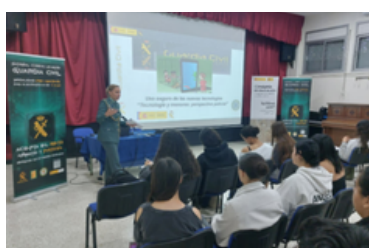
La ciberseguridad presente en la Acción Educativa Exterior