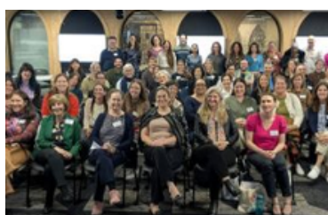
III Congreso Nacional de Enseñanza de Español de Australia